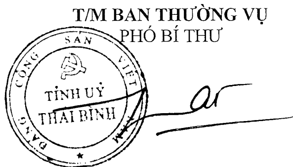
Ngô Đông Hải